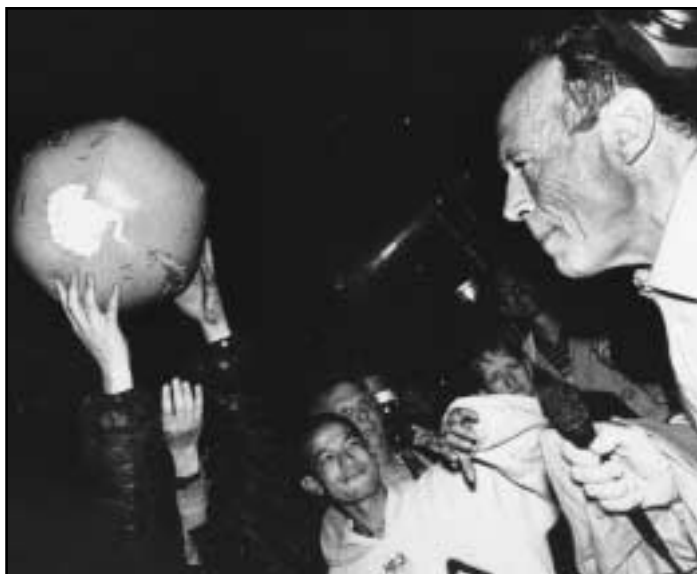
Selvom nej-siden ikke vandt afstemningen om Amsterdam-traktaten i maj 1998, så fejlede humøret ikke noget hos modstanderne.