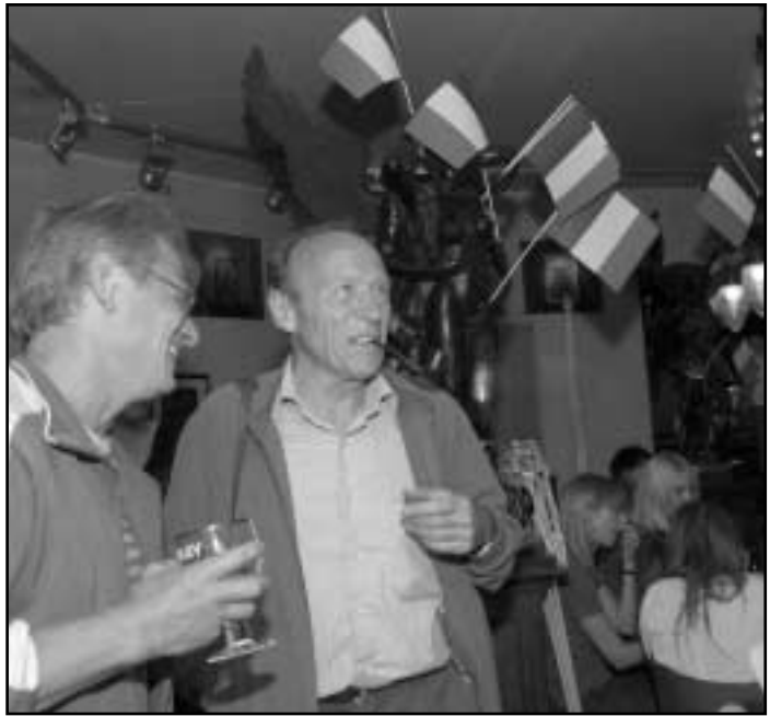
Feststemningen var markant, da Ole Krarup og Folkebevægelsen fulgte optællingen af stemmer ved den franske folkeafstemning om EU-grundloven i maj 2005.

tager til det brede ”Borgerinitiativet ja til Europa – nej til EU-forfatning”, og inden for og omkring SF opstod nej-initiativer som Socialister mod Traktaten (SMOT) og Udfordring Europa.